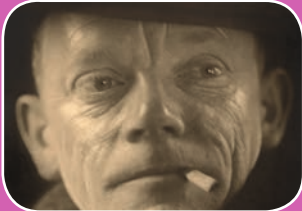
Kino: Karl Valentin