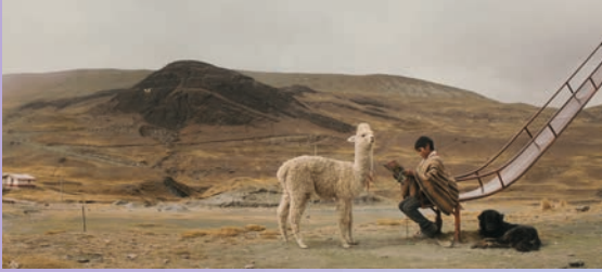
»Durch Felsen und Wolken« (Do. 3.10., 15.00 Uhr)

Die 39. Festivalausgabe steht vor der Tür, und auch in diesem Jahr wird die Lagerhalle zu einem Ort, an dem die Vielfalt des unabhängigen Kinos gefeiert wird. Mit einer bunten Mischung aus internationalen Produktionen, spannenden Debüts und bewegenden Geschichten lädt das Festival ein, sich in die Magie des Films zu verlieren und neue Perspektiven zu entdecken. Das Publikum in der Lagerhalle kann sich auf acht Langfilme und sechs Kurzfilmprogramme freuen.