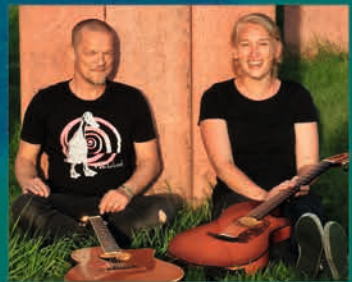
Do., 24.04.2025 20:00 Uhr FRINK! Rau - Wild - Warm