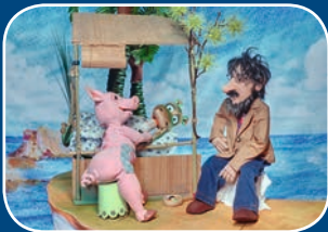
Klassiker: Urmel aus dem Ei