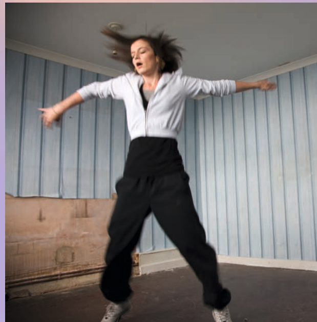
»Fish Tank« (Fr. 4.10., 20.00 Uhr)

Ausführliche Informationen zum Gesamtprogramm unter: filmfest-osnabrueck.de