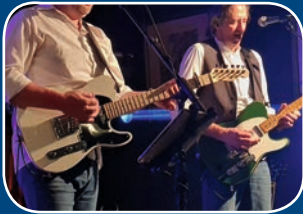
Altstadt live: Quo Riffs