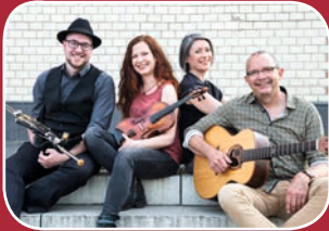
Weltklasse Irish Folk: CARA