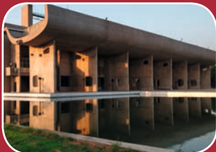
Kino: Kraft der Utopie

Rolandsmauer 26 49074 Osnabrück www.lagerhalle-os.de mail: info@lagerhalle-os.de fon: 0541-33874-0 fax: 0541-33874-50