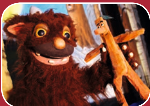
Für Kids: Das Grüffelkind