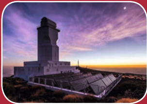
Kanaren: Sieben Inseln