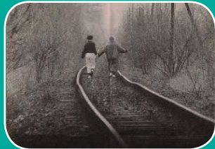
Kino: Winter adé

Rolandsmauer 26 49074 Osnabrück www.lagerhalle-os.de mail: info@lagerhalle-os.de fon: 0541-33874-0 fax: 0541-33874-50