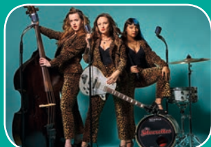
CD-Release: The Silverettes